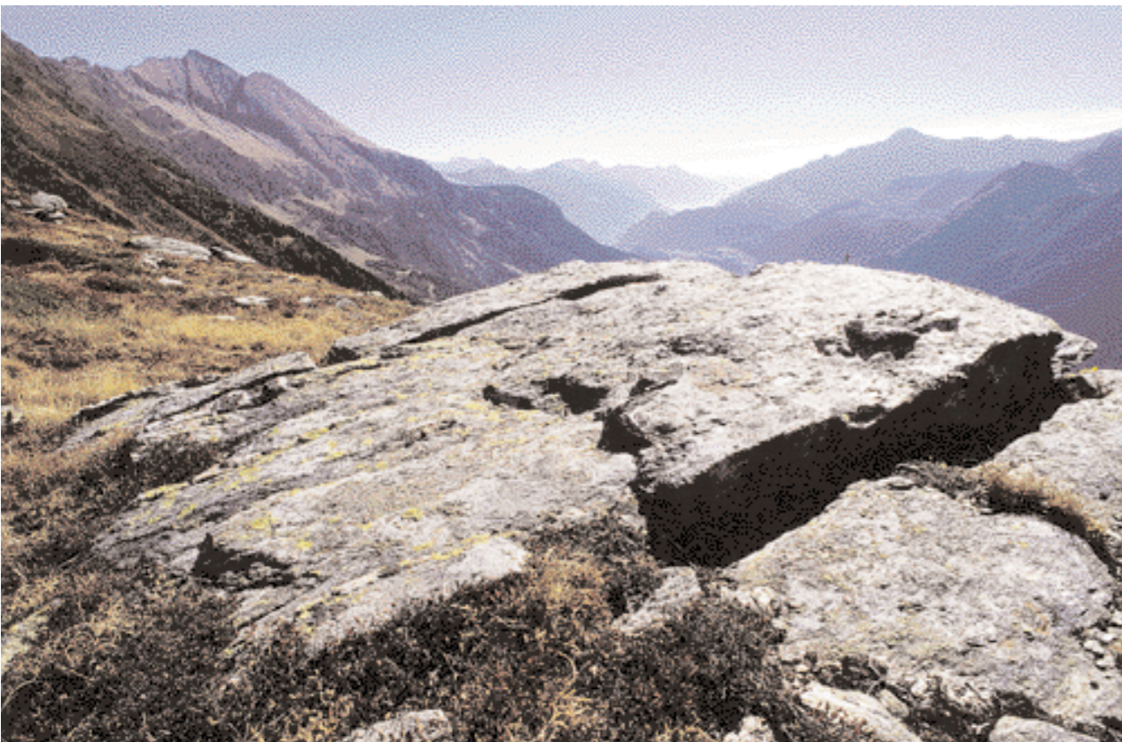
Dalla Forca: il Pécianett e la cresta Motto Crostel-Matro. Sullo sfondo Piz de Strega, Torent Alto e Pizzo di Claro.