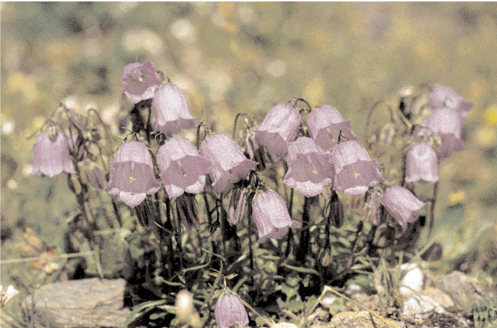
Campanula dei ghiaioni ( Campanula cochlearifolia )