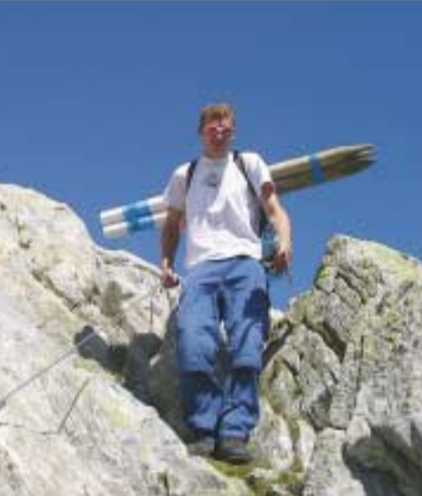
Il tratto dotato di corde fisse Das Teilstück mit fixen Seilen

Si ringrazia per il contributo: Besten Dank für die Unterstützung: