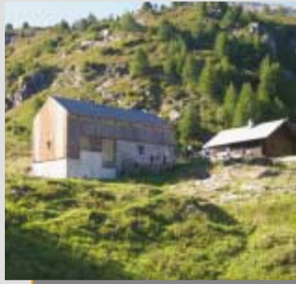
• Bovarina 1870 m