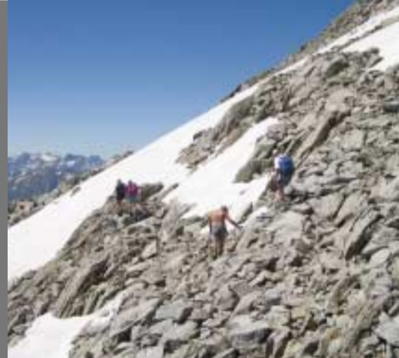
Ad inizio e fine stagione prestare attenzione alla neve sul percorso Anfangs und Ende Saison ist auf der Route den Schneefeldern Aufmerksamkeit zu schenken

Bus: Autolinee Bleniesi, tel. 091 862 31 72 Taxi: tel. 091 872 11 24