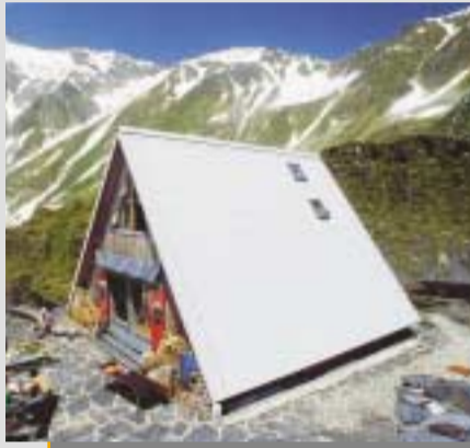
• Scaletta 2205 m